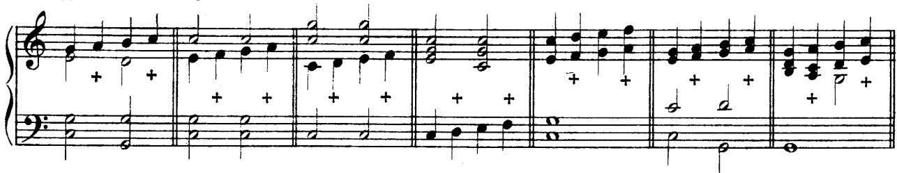
Діатоническія проходящія ноты во всѣхъ голосахъ.

Въ данномъ примѣрѣ проходящія ноты отмѣчены крестикомъ; въ послѣднихъ трехъ тактахъ проходящія ноты представлены въ двухъ и трехъ голосахъ; но вообще же должно сказать, переполненіе аккордовъ проходящими нотами, въ ущербъ гармоническимъ и въ ущербъ ясности самой гармоніи, неодобрительно, — оно можетъ быть оправдываемо лишь съ высшей художественной точки зрѣнія, когда требуется самостоятельное проведеніе избраннаго мотива по всѣмъ голосамъ, въ работахъ контрапунктическихъ.